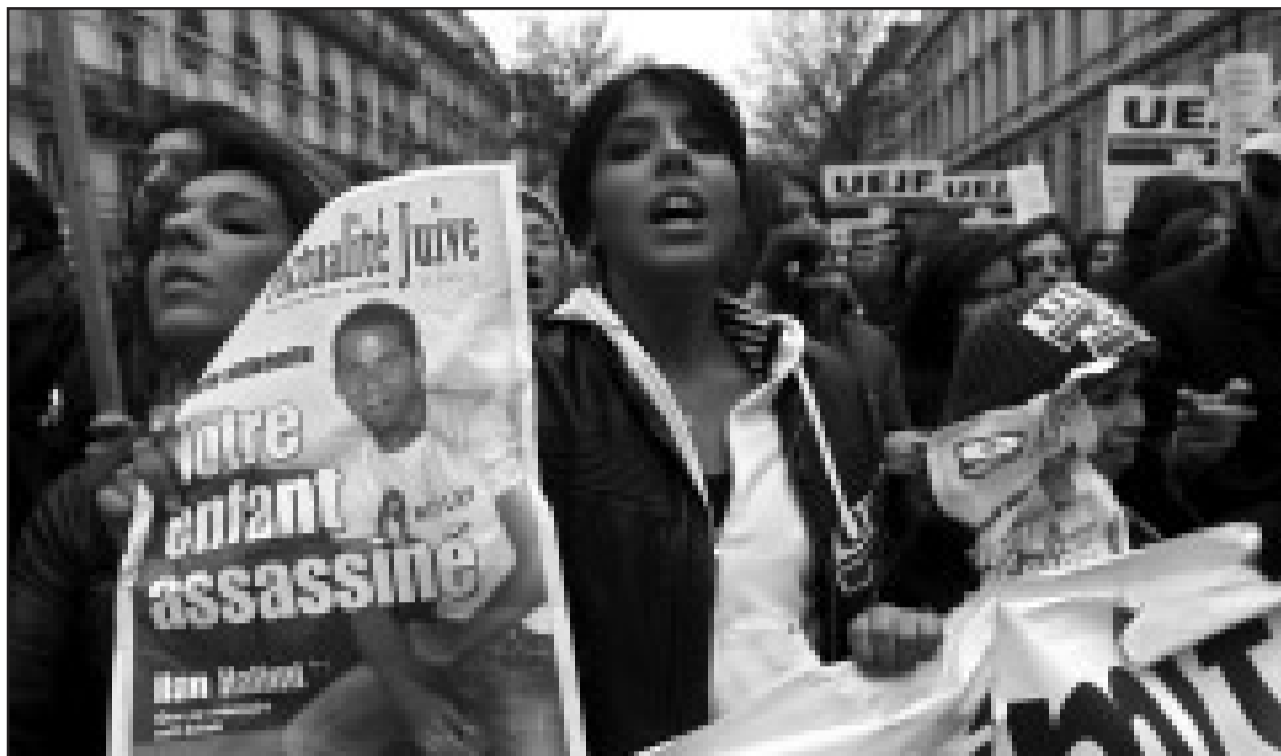
Zeichen gegen Antisemitismus: Zehntausende gingen nach dem Mord an Ilan Halimi in Paris auf die Straße.

Die Trauerfeier vereinte alle politischen Parteien sowie religiöse Führer islamischer und jüdischer Vereinigungen. Rund 1500 Menschen nahmen an dem Trauergottesdienst in der Pariser Synagoge la Victoire, einer der größten Europas, teil. Großrabbiner Joseph Sitruk sagte nach der einhalbstündigen Zeremonie: „Frankreich hat nicht seine Seele verloren.“