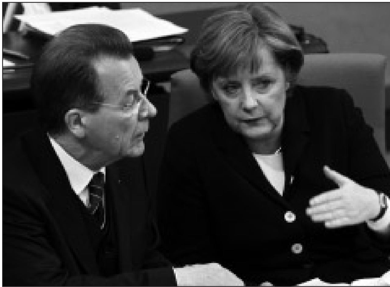
Konnten die Menschen bisher für ihre Politik begeistern: Bundeskanzlerin Angela Merkel und Arbeitsminister Franz Müntefering.

Die Bundeskanzlerin hat so wichtige Akzente im Bereich der Außen- und Sicherheitspolitik, und mit ihrem Koalitionspartner Franz Müntefering auch im Bereich der Arbeitsmarkt- und Finanzpolitik gesetzt, die über die Einigkeit mit dem Koalitionspartner hinaus, die Fortsetzung des konsequenten Reformkurses für die Zukunft erkennen lassen. „Dies schafft spürbare Zuversicht in weiten Kreisen der Gesellschaft, trotz schwieriger und schmerzhafter Einschnitte gerade im sozialen Bereich“, meint Spiegel zuversichtlich. „Auch hinsichtlich der speziellen Situation der jüdischen Gemeinschaft in der Bundesrepublik Deutschland, als drittgrößte Westeuropas und immer noch am stärksten wachsende, wissen wir in der Regierung verlässliche Freunde und Partner an unserer Seite“, so Spiegel. „Angesichts der schwierigen Integrationsprozesse von zugewanderten Juden aus der ehemaligen Sowjetunion, einer desolaten Infrastruktur in vielen jüdischen Gemeinden und einem stetig anstei-