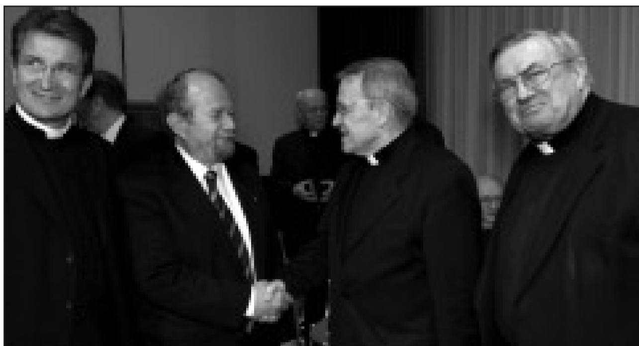
Begegnung auf Augenhöhe: Bischof Wolfgang Huber, Rabbiner Henry Brandt, Kardinal Kasper und Kardinal Lehmann.

Kasper hob hervor, dass nach der Shoah ein Umdenken in den Kirchen begonnen habe und diese ihre jüdischen Wurzeln neu entdeckt hätten. Diese Neuorientierung gehe weit über politisch-ethische Fragen hinaus und betreffe die christliche Identität in ihrem Kern, sagte der Kurienkardinal. Die vor 40 Jahren vom Zweiten Vatikanischen Konzil formulierten Einsichten müssten aber immer wieder neu in den Gemeinden vermittelt und praktisch verwirklicht werden. Der Dialog zwischen Kirche und Judentum habe gezeigt, dass ein neuer Anfang möglich ist, und damit auch einen Beitrag zum Frieden in der Welt geleistet, so der Kardinal: „Wir brauchen einander, und die Welt braucht