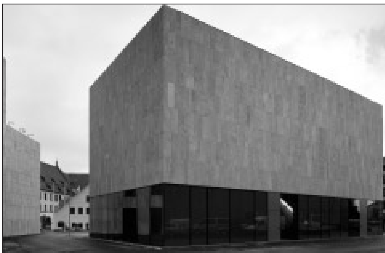
Schaufenster zur Stadt: Mit seinem verglasten Foyer öffnet sich das neue Jüdische Museum zum St.-Jakobs-Platz.

Die Sammlungsbestände des Jüdischen Museums München sind leider noch recht fragmentarisch und auch Neuzugänge meist von puren Zufällen bestimmt. Aus dieser Not will das Jüdische Museum jedoch eine Tugend machen und verstärkt temporäre