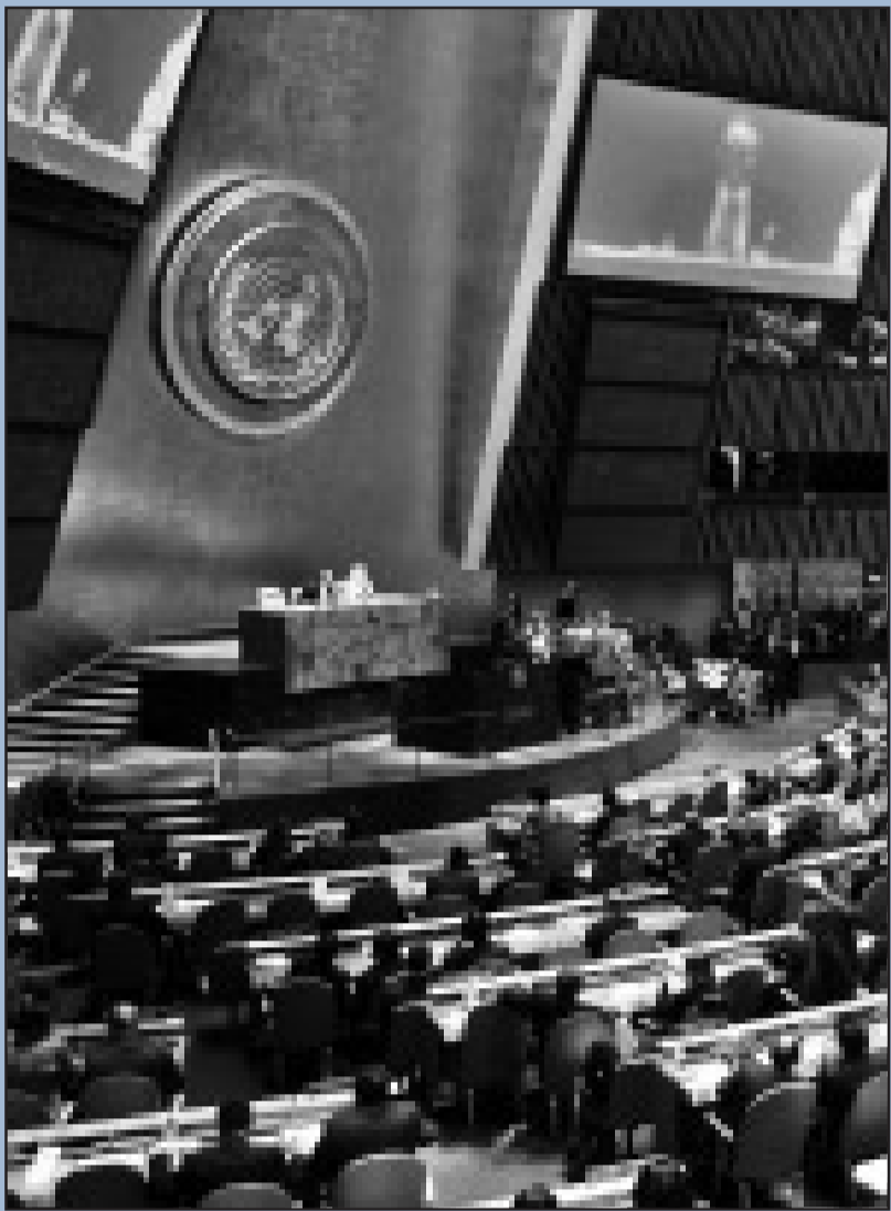
Lob für eindeutige Entscheidung: Die Mehrheit der 192 in der UN vertretenen Staaten zeigt Holocaust-Leugnern die rote Karte.

Mit einem als „historisch“ gerühmten Beschluss hat die UN-Vollversammlung Ende Januar allen Leugnern des Holocausts eine klare Absage erteilt. Das Gremium der 192 UN-Mitgliedsstaaten sprach sich dafür aus, die Erinnerung an den Holocaust wach zu halten und somit einem neuen Völkermorden vorzubeugen.