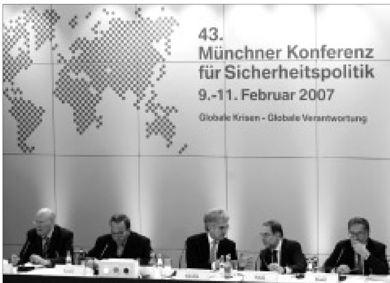
Agent Provokateur: Irans Chefunterhändler Ali Laridschani wiederholte gegenüber den Teilnehmer der Münchener Sicherheitskonferenz erneut Äußerungen zur Leugnung de Holocaust.

„Die Forderung der sogenannten iranischen „Holocaust-Stiftung“ nach Übersendung von Beweisdokumenten ist eine der vielen Provokationen des iranischen Holocaustleugners Ahmadinejad. Ahmadinejad versucht die Tatsache des millionenfachen Völkermords an den Juden und anderen Opfergruppen systematisch zu leugnen, indem mit pseudowissenschaftlichen Inszenierungen Propaganda betrieben wird. Ich emp-