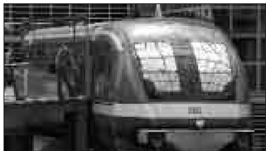
Entsetzen über geplanten Verkauf von deutschen Transrapid-Zügen in den Iran.

Zentralrat empört über deutsche Beteiligung am geplanten Bau der neuen Bahnstrecke für den „Pilgerzug“