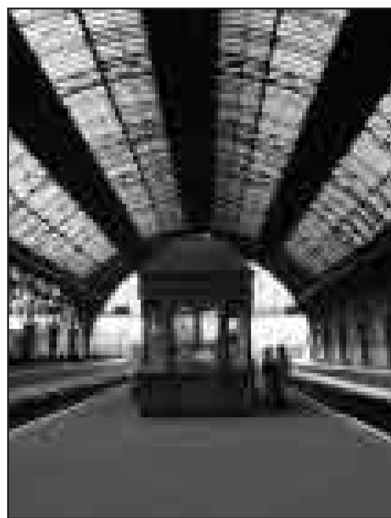
Spuren der Geschichte: Blick in den alten Bahnhof von Lemberg (re.).