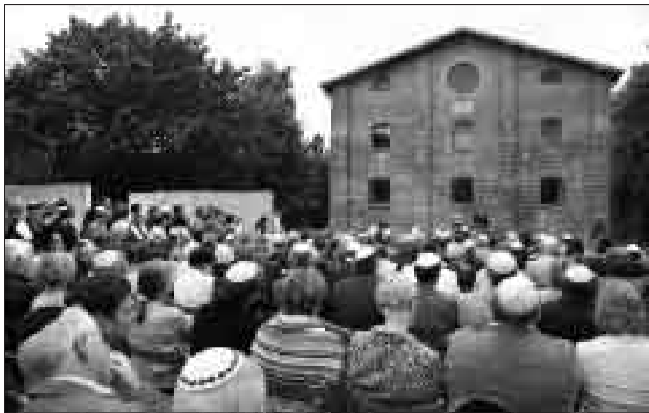
Feststimmung: Viele Gemeindemitglieder und zahlreiche Ehrengäste feierten am 24. Juni den Einzug ins neue Gemeindezentrum.

Bis zuletzt wurde auch im Keller des Gemeindezentrums die Mikwe gefliest und geschrubbt. Sie ist die einzige in Schleswig-Holstein. In sanftem Beige gehalten, strahlt der Raum Ruhe und Geborgenheit aus. Im Gegensatz dazu sind die Kinder- und Jugendräume farbenfroh, Bücher und