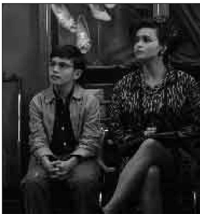
Im Jewish-Filmfest der englische Film „Sixty Six“, der von Bernies (hier mit seiner Mutter) Bar-Mizwa-Vorbereitungen erzählt.

Den Abschluss des Kultursommers bildet die Lange Nacht der Museen am