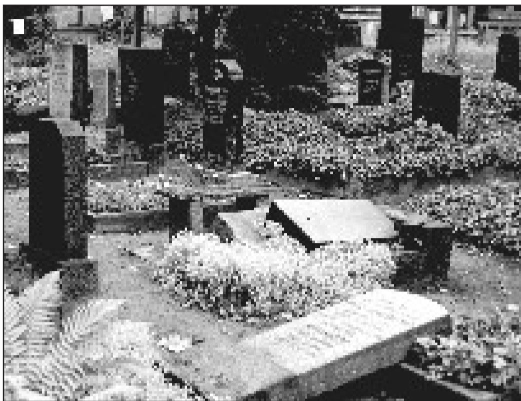
Кладбище в Берлине-Вейсензее – ужасный вид: количество еврейских кладбищ, которые в последние годы осквернены, резко возросло.

вал от Федерального правительства решительных действий. Необходимо, «чтобы вопросами борьбы с правым экстремизмом и антисемитизмом занимался уполномоченный на федеральном уровне, в сфере деятельности которого входили бы сбор и оценка всей имеющейся информации, касающейся правоэкстремистских и антисемитских действий, а также составление итогового ежегодного отчета по этой тематике. «Тогда, к примеру, у консультационных служб для жертв правового насилия имелся бы компетентный партнер», – заявил Крамер. Его призыв, кажется, был услышан в бундестаге.