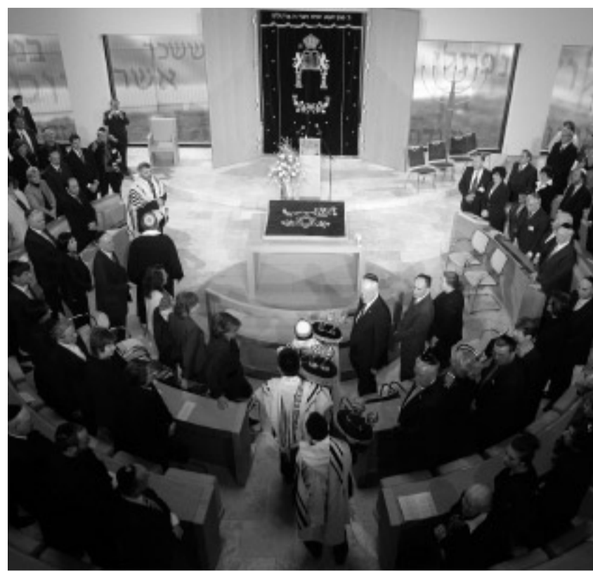
Jetzt haben die 1200 Bochumer Gemeindemitglieder wieder ein neues Zuhause: Die neue, moderne Synagoge bietet 600 Besuchern Platz.

Dank zu sagen, ist ebenfalls den 24 Bochumer Richtern und Richterinnen, die - als NPD und „freie Kameradschaften“ mit der Parole „Stoppt den Synagogenbau“ durch die Stadt ziehen wollten - öffentlich erklärten: „Diese Demonstration richtet sich nicht nur gegen die Glaubensfreiheit der Jüdischen Gemeinde. Sie würde zugleich einen späten Versuch der Wiedergutmachung für die Verbrechen verhöhnern, die unsere Vorfahren an