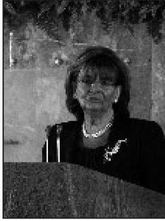
Zentralratspräsidentin Charlotte Knobloch

[...] Die Situation im Nahen Osten, die permanente Bedrohung durch Terroristen und Terrorstaaten sowie der Zwang zur Verteidigung machen es nicht immer einfach, an einer Kultur des Friedens festzuhalten. Und dennoch: Bei all seinen Handlungen achtet der jüdische Staat das Völkerrecht, die Menschenrechte und verbürgt sich dafür, all seinen Bürgern - auch den nichtjüdischen - ohne Unterschied von Religion, Rasse oder