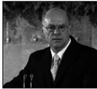
Bundestagspräsident Norbert Lammert

[...] Между возникновением обоих государств (Германия и Израйля – прим. ред.), между датами и событиями, существует внутренняя связь. Государство Израйль было основано на пепле Холокоста, вторая немецкая демократия – на обломках тоталитарного режима, грубейшим образом попранным достоинством человеческого достоинства. Этот режим, чья идеология представляла собой чудовищную смесь человеко-ненавистничества и мании величия, вверг свою страну в политическую, экономическую и моральную ката-